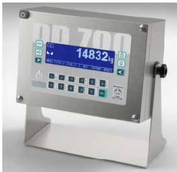
DD700ic VERSIONE INDUSTRIALE