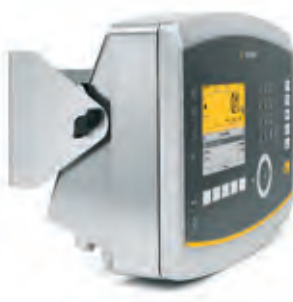
Il Maxxis 5 con staffa di montaggio multifunzione