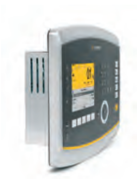
Il Maxxis 5 con un design sottile per il montaggio a pannello

Con il Maxxis 5 non è mai stato più facile collegarsi ad ogni altro sistema. Tutti gli ingressi sono etichettati in modo chiaro e facilmente accessibili sul retro del controllore. Non dovete far altro che inserire i connettori e configurare il controllore per vedere immediatamente tutti i benefici che un sistema controllato tramite il Maxxis 5 può offrirvi.