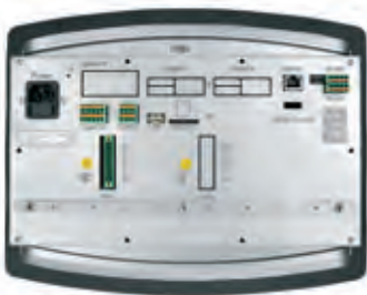
Vista posteriore di un Maxxis 5 montato a pannello