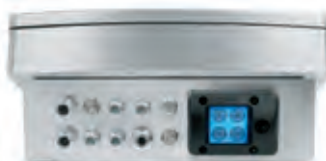
Vista posteriore con passacavi e sistema EzEntry