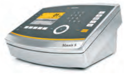
Montaggio su banco per il Maxxis 5 per una facile interazione quotidiana