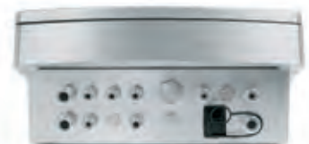
Vista posteriore con passacavi e connettore Ethernet opzionale